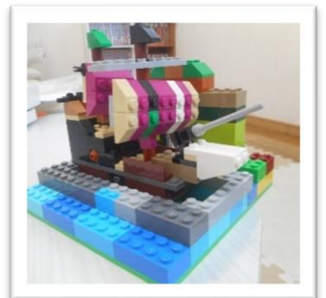
↑工作が得意な中学1年の男の子がレゴブロックで船を作りました