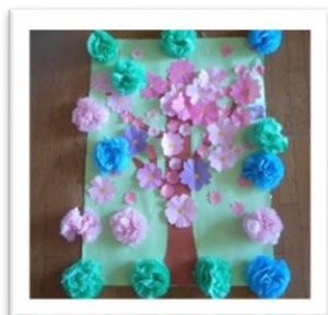
←お絵描きや工作が好きな児童を中心に、毎月みんなで一つの壁面装飾を作っています(春壁面装飾)