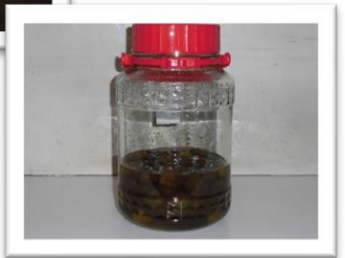
↓前号掲載の梅シロップ出来上がり