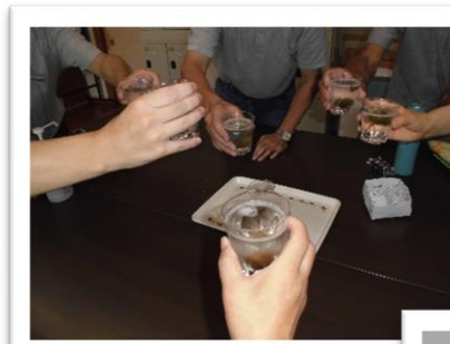
←出来上がった梅シロップで乾杯